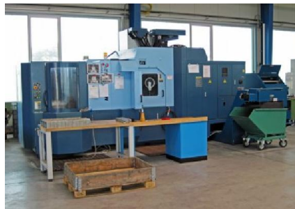
Blick in die Fertigung: Vertikal-Bearbeitungszentrum für 5-Achsen-Bearbeitung.